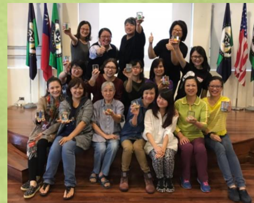
兒童科普教育及關懷培力研習會_好 好說個科學故事：說故事與演故事/ 雪花罐手作包(台北)