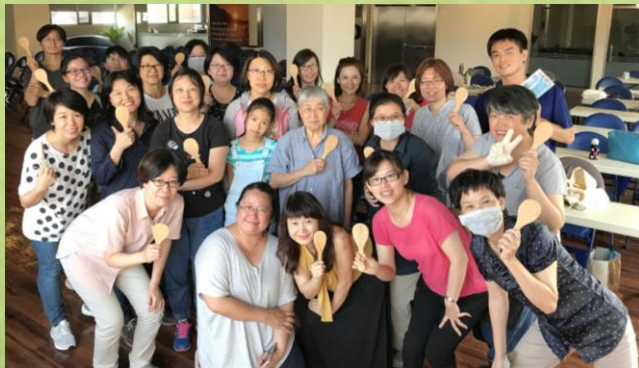
兒童科普教育及關懷培力研習會_自然觀察家： 隨處可做的觀察紀錄/ 檜木匙手作包(台北)