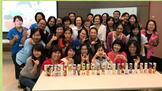
兒童科普教育及關懷培力研習會_光的遊戲： 光的萬千世界 / 萬花筒手作包(台中)