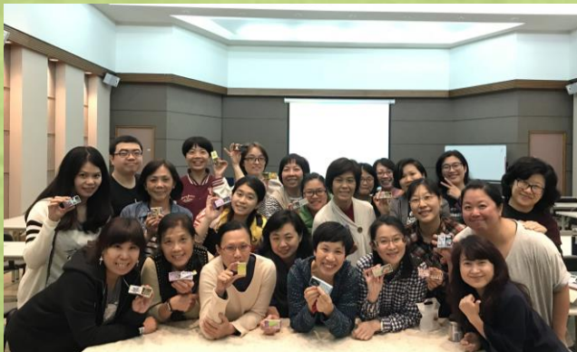
兒童科普教育及關懷培力研習會_科學插畫： 告訴你數字真“象” /火柴盒手作包(台中)

活動報導： https://twaf.eoffering.org.tw/contents/news_ct?id=215