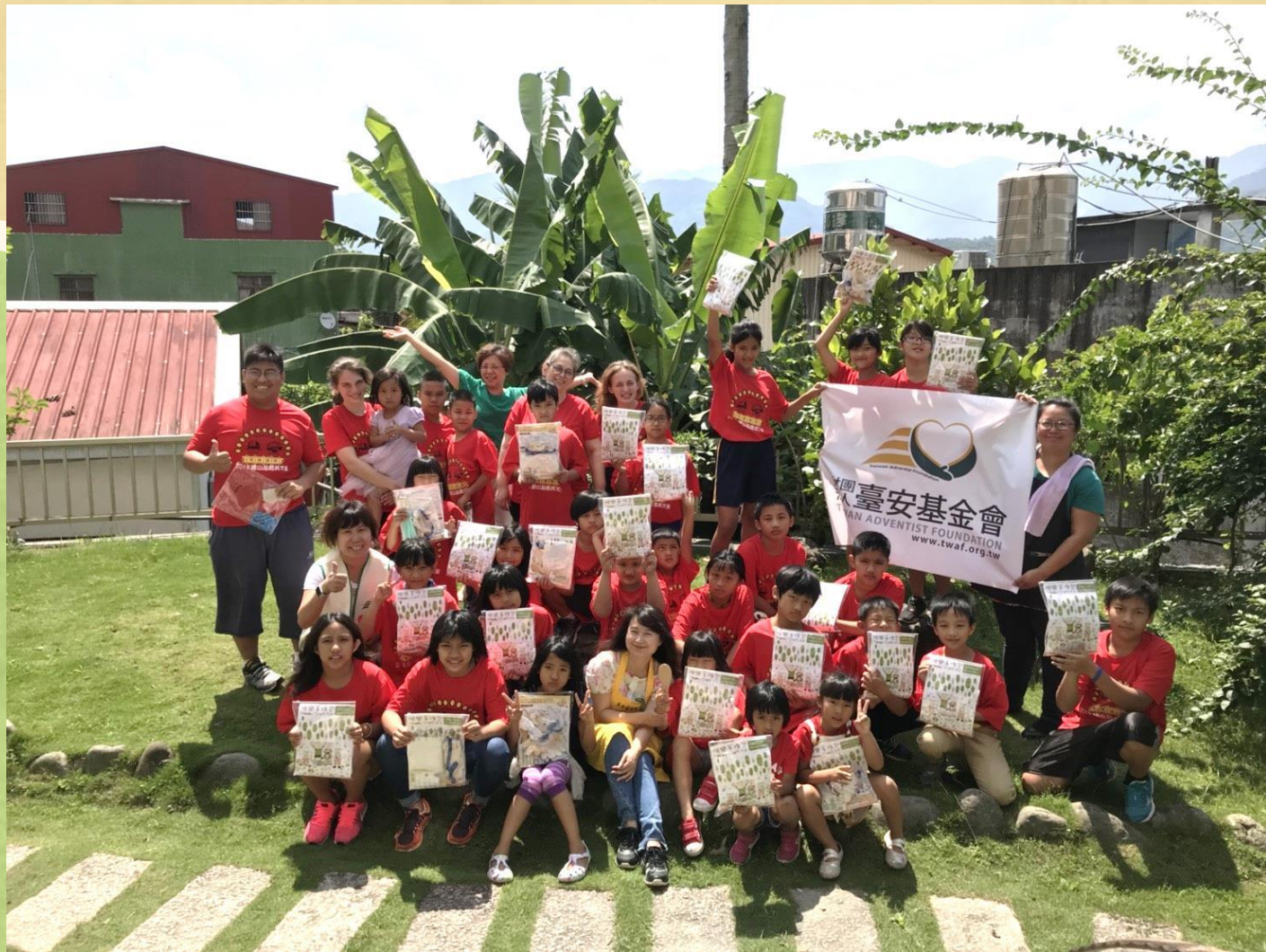
高雄建山英文品格夏令營